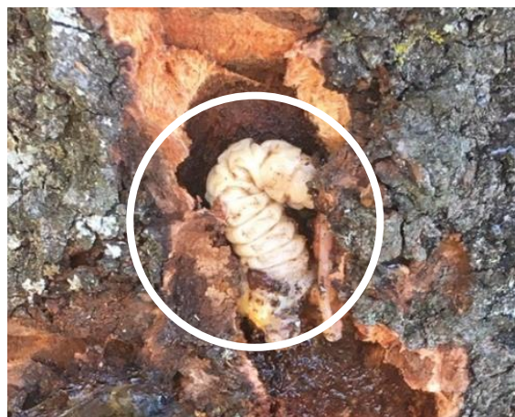
写真 サクラに寄生するクビアカツヤカミキリ幼虫

今後も被害地域は徐々に拡大していくと考えられるが、樹体内への穿孔被害を確認してからの対策では根絶が難しい。本種に対する樹幹散布の登録剤が増えつつあるので、ウメ、モモ、スモモ等の果樹や、サクラ、ハナウメ、ハナモモ等の花木類を生産している方々は成虫防除による予防対策についてご一考頂きたい。