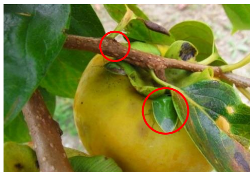
写真. カキを加害するカメムシ類 (チャバネ、ツヤアオ)

8月以降は一部の地域で一晩の誘殺数が100頭を超えることはあったが、スギ・ヒノキの球果数が少なく県内全体でみると新成虫の発生数は少ないと推測される。